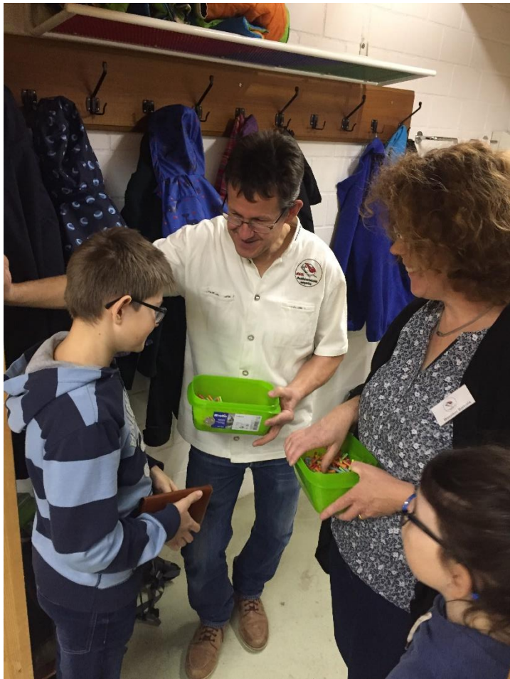
Auch wieder mit einer schönen grossen Tombola