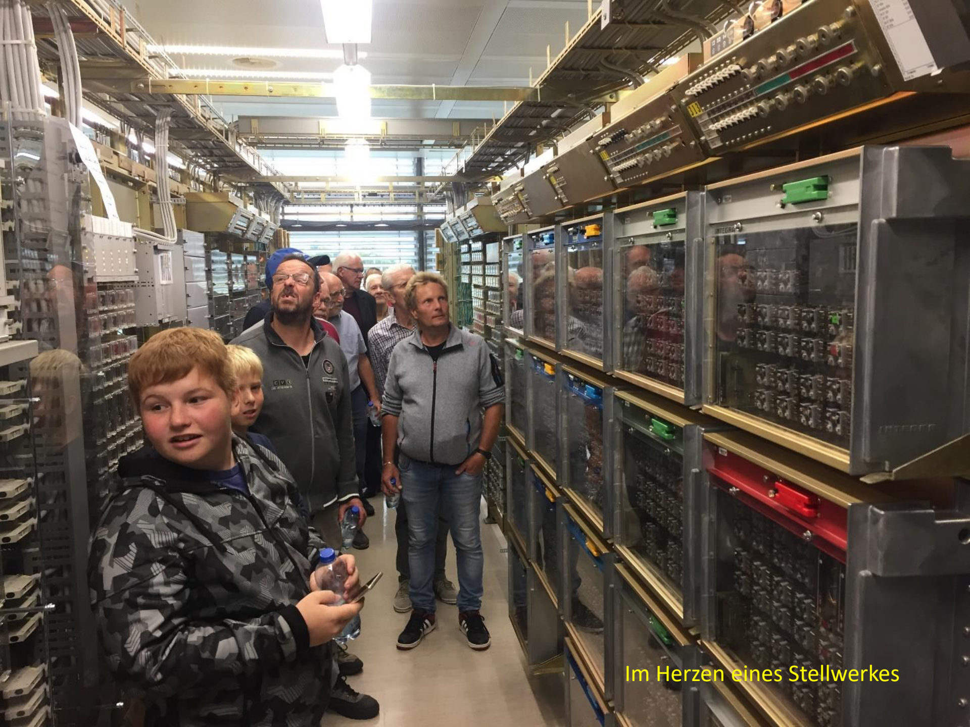
Im Herzen eines Stellwerkes