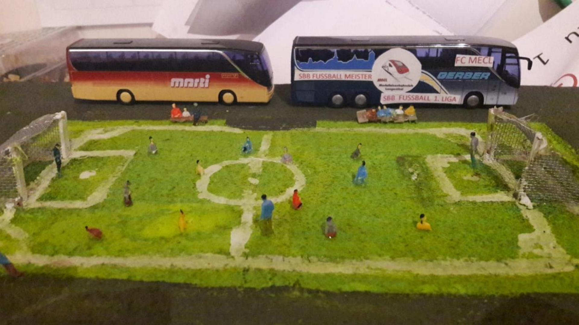
Cederic hat ein Fussballplatz mit unserem eigenen FC MECL Bus gestaltet.