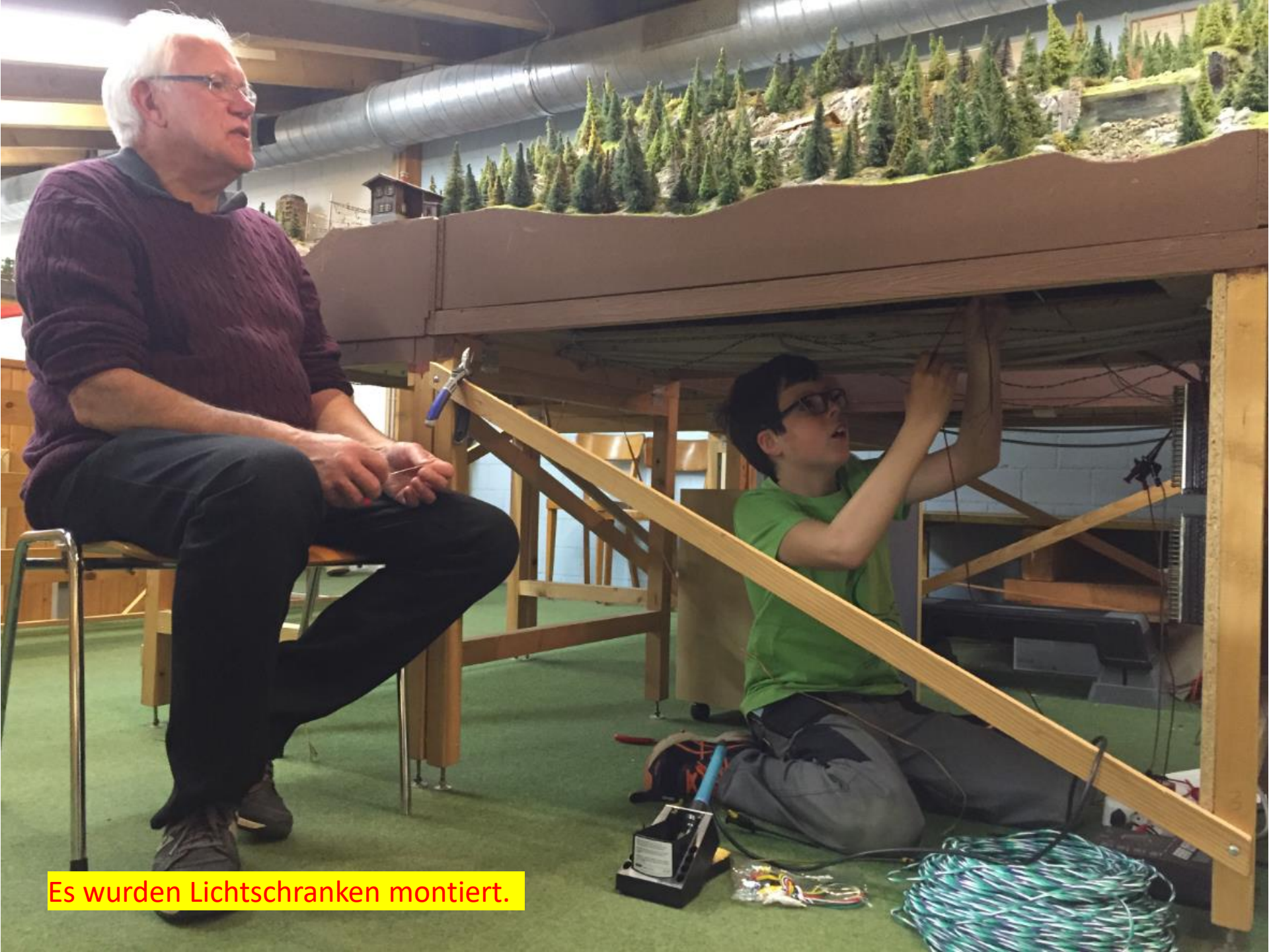
Es wurden Lichtschranken montiert.