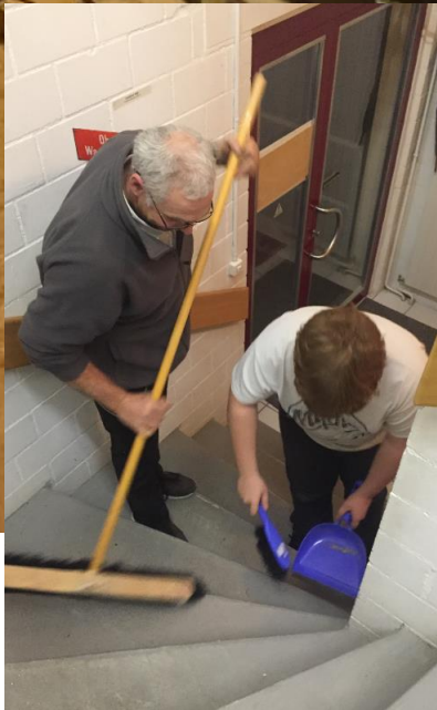
Auch die Entrümpelungsaktion hat viel gebracht.